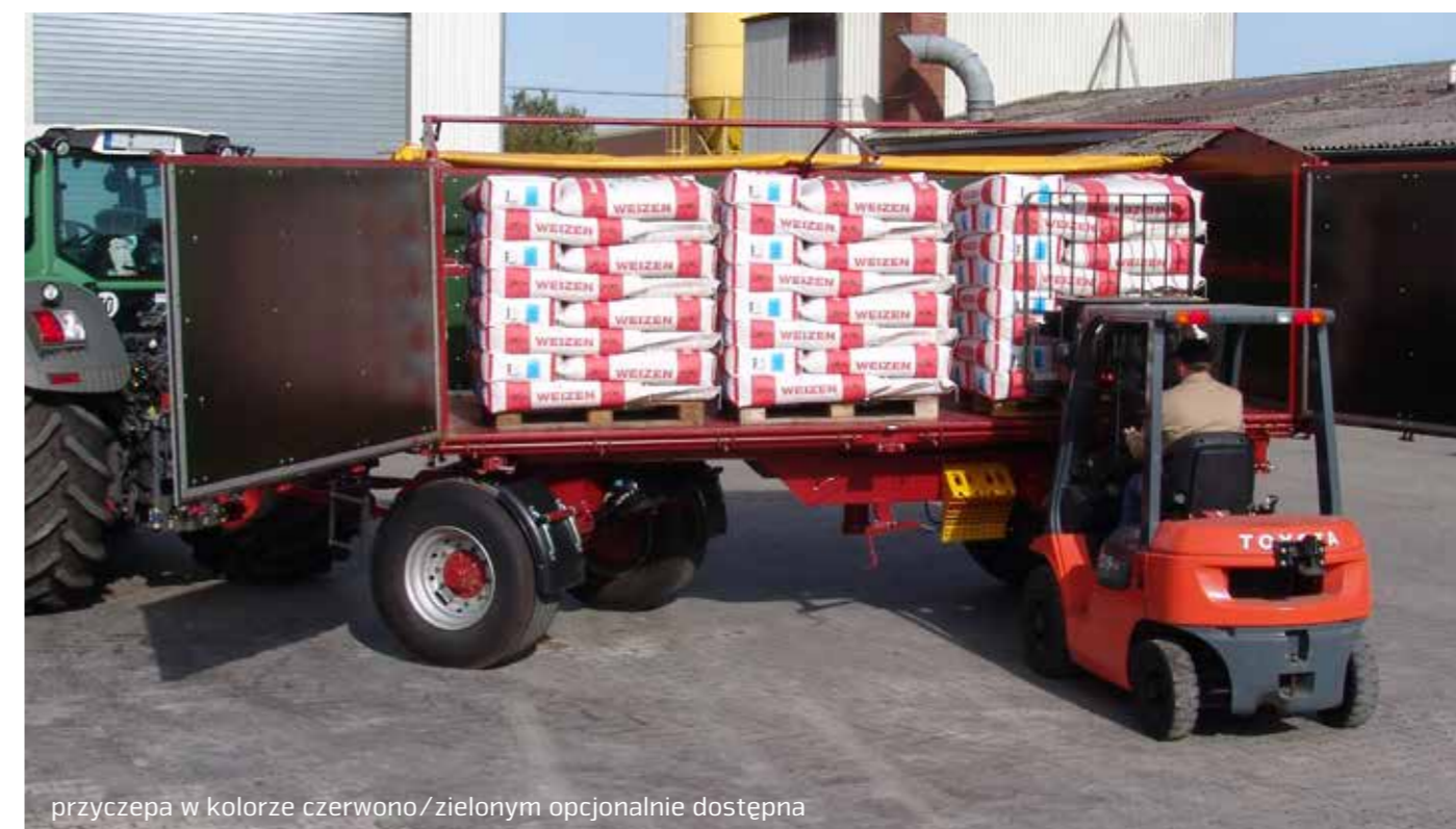
przyczepa w kolorze czerwono/zielonym opcjonalnie dostępna

Możliwość zmian technicznych, wyposażenie i opcje zgodnie z tabelą na stronie 19