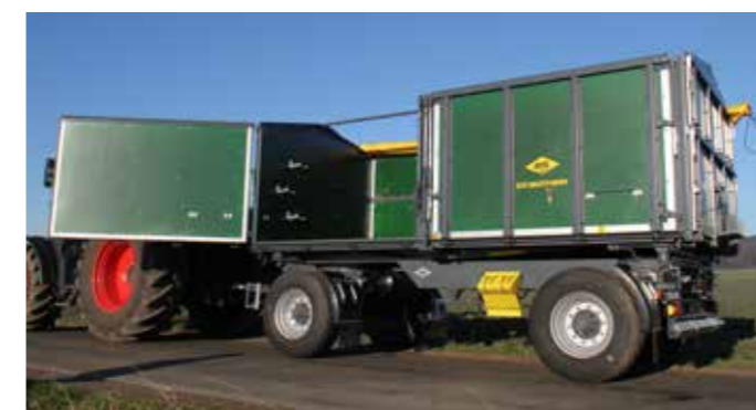
Możliwość zmian technicznych, wyposażenie i opcje zgodnie z tabelą na stronie 19