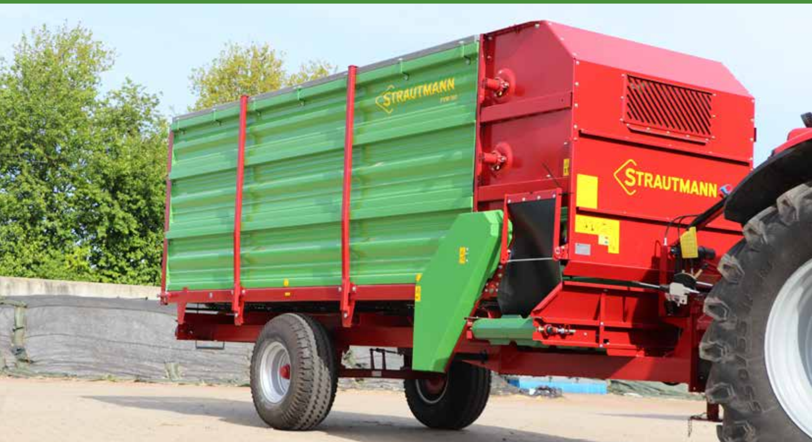
Remorque distributrice de fourrage