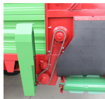
Technische Änderungen vorbehalten