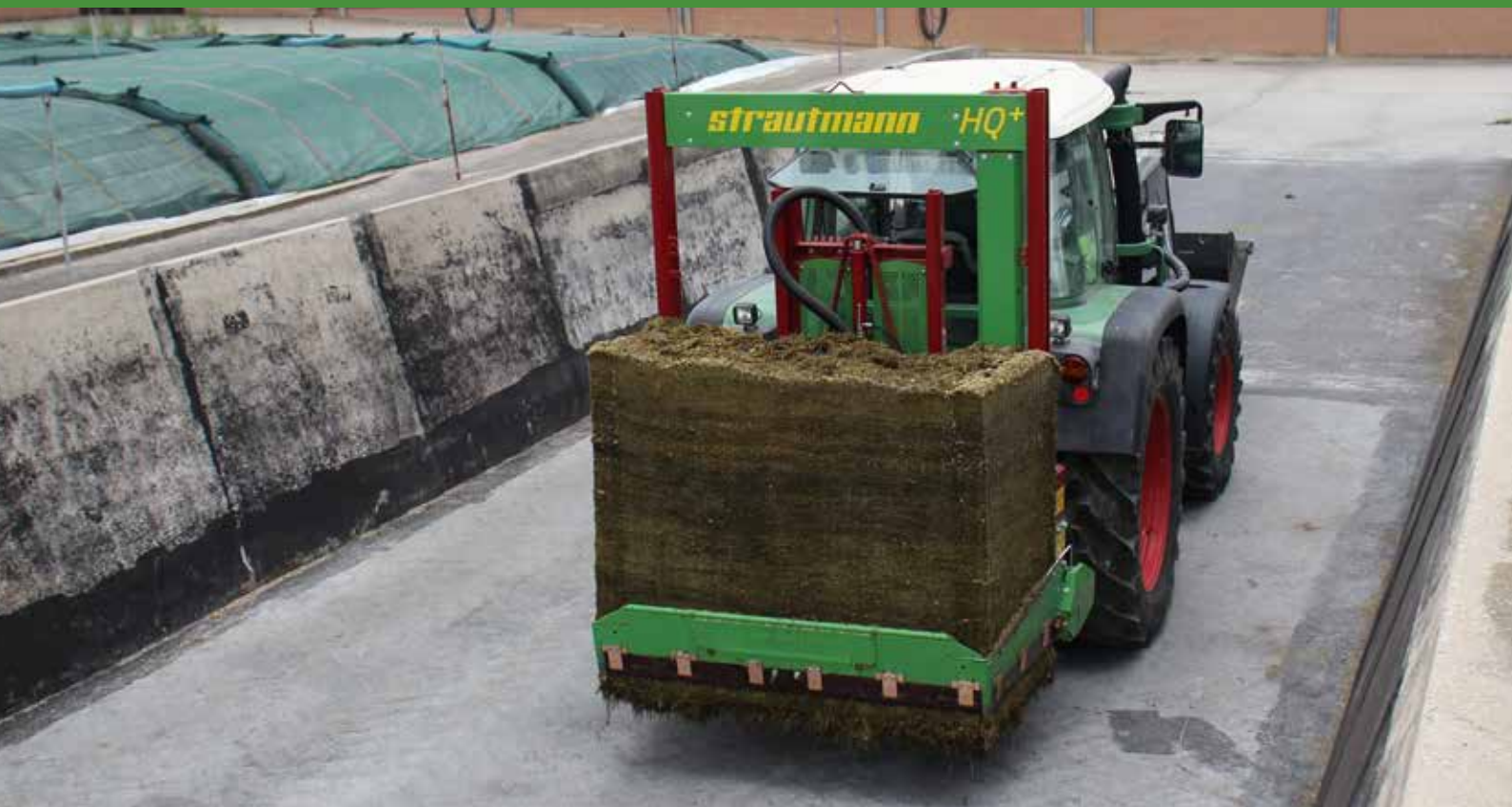
Wycinak bloków kiszonkowych