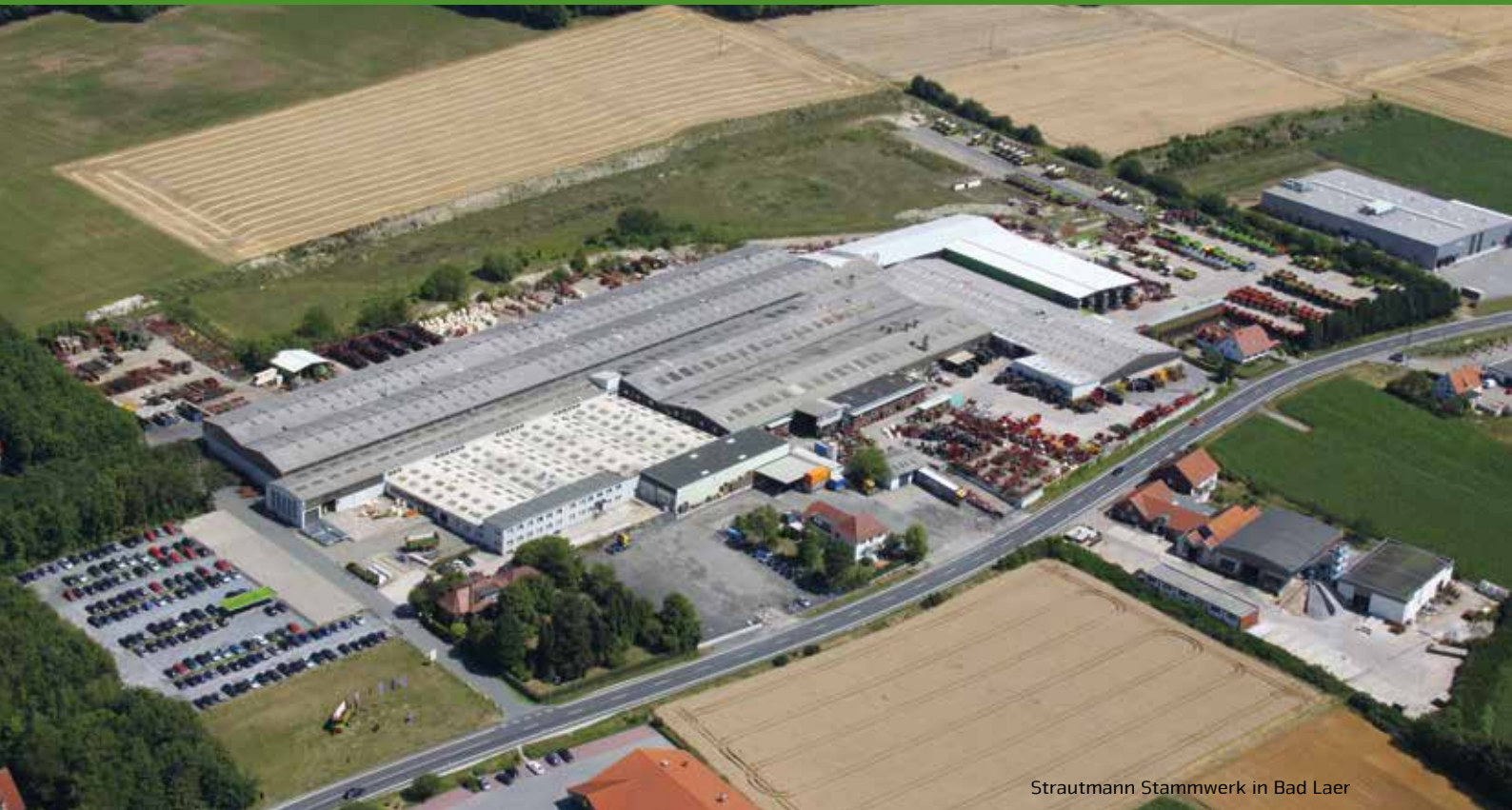
Strautmann Stammwerk in Bad Laer

Das Unternehmen B. Strautmann & Söhne GmbH u. Co. KG ist ein mittelständisches Familienunternehmen im südlichen Niedersachsen, das nun nach über 80-jährigem Bestehen in der dritten Generation geführt wird. Am zweiten Produktionsstandort in Lwówek (Polen) produziert Strautmann in einem modernen Werk neben einzelnen Maschinenkomponenten auch Teile des Maschinenprogramms,